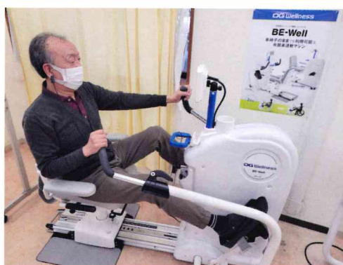
クロスステップ(車椅子可)