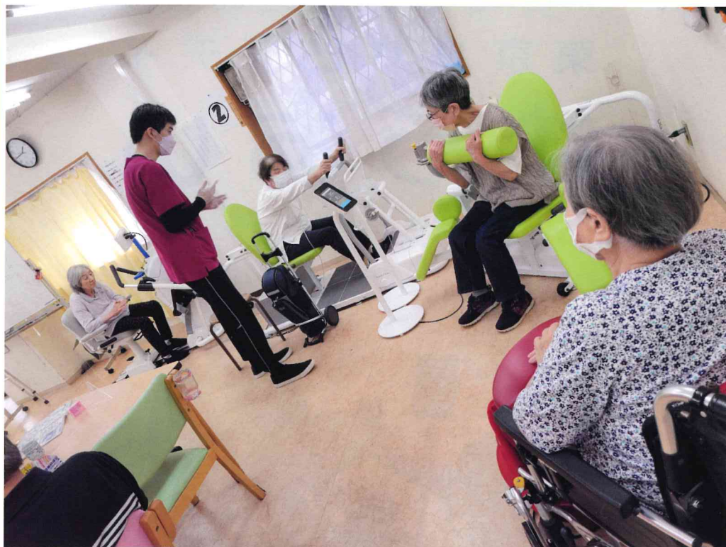
ゆうあいフロア&リハビリスペース